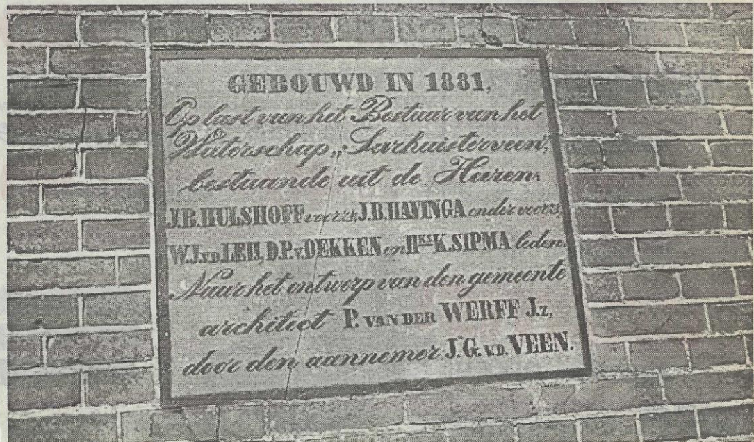
Foto van de steen in de gevel van de voormalige sluiswachterswoning bij Roodeschuur, die bij de bouw in 1881 werd geplaatst.