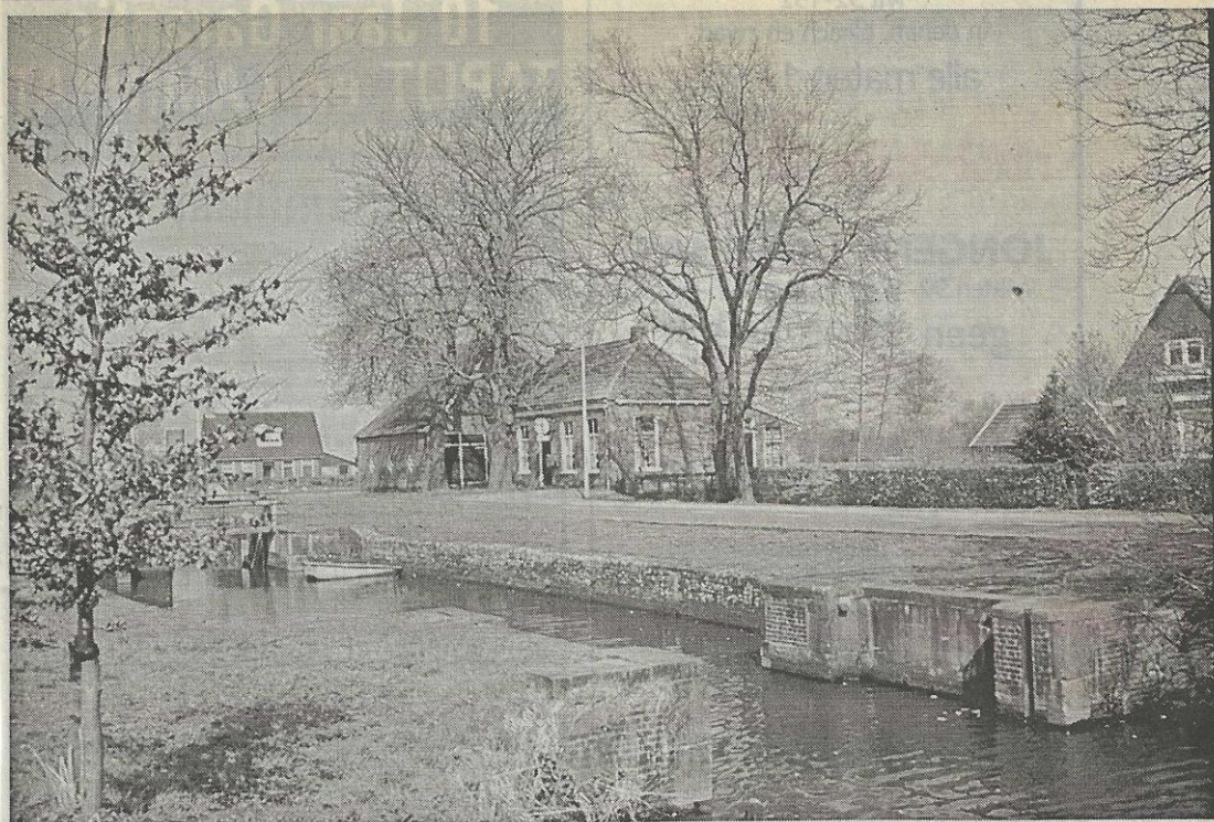
Dit is een opname uit 1999 van de sluis met de voormalige sluiswachterswoning bij Roodeschoor.